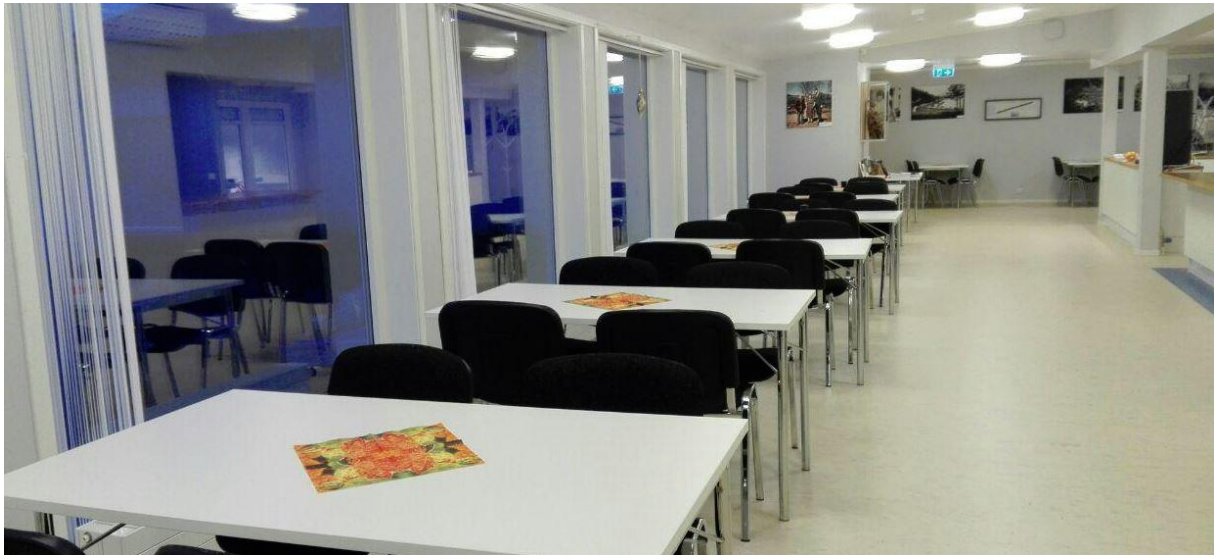
Foto: Kaférommet i de nye lokalene i Hommelstø.

Med disse noe dystre ord om et vanskelig år er det på sin plass å understreke at vi ser framover med stor optimisme. I årene som kommer vil forholdene for ei god og kontinuerlig drift ligge langt bedre til rette, der fagstaben i Helgeland Museum har kommet på plass, og avdelingsleder lokalt er ansatt på permanent basis og det nye museumsbygget ferdigstilles utvendig og innvendig, med permanent utstilling og bedre forhold for framføringer. Det vil også bli enklere å planlegge prosjekter på kort og lang sikt med en fagstab og avdelingsleder tilbake i full drift.