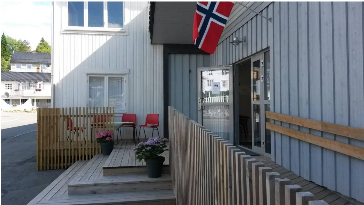
Foto: Inngangspartiet til Helgeland Museums nye lokaler i Hommelstø. Bildet er tatt i juni 2016, med nysnekret påbygg av platten og duk på bordet. Noen få øyeblikk før en uforutsett regnskur..!