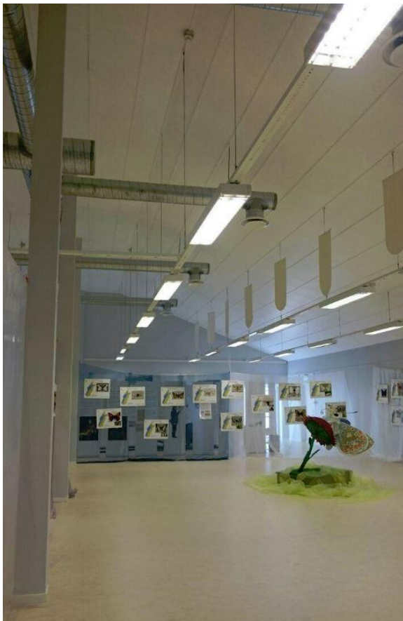
Foto: Sommerfuglutstilling i utstillingsrommet i Gamle Samvirkelaget i Hommelstø.

Ellers kan vi nevne at turistnæringa i Velfjord ser ut til å være voksende både innen opplevelser og overnatting. Dette er svært positivt for museet. Lomsdal-Visten Nasjonalpark med inngang fra Velfjord anses å være et natur- og kulturhistorisk område som i større grad kan bidra til økonomisk vekst både for museet og andre aktører lokalt.