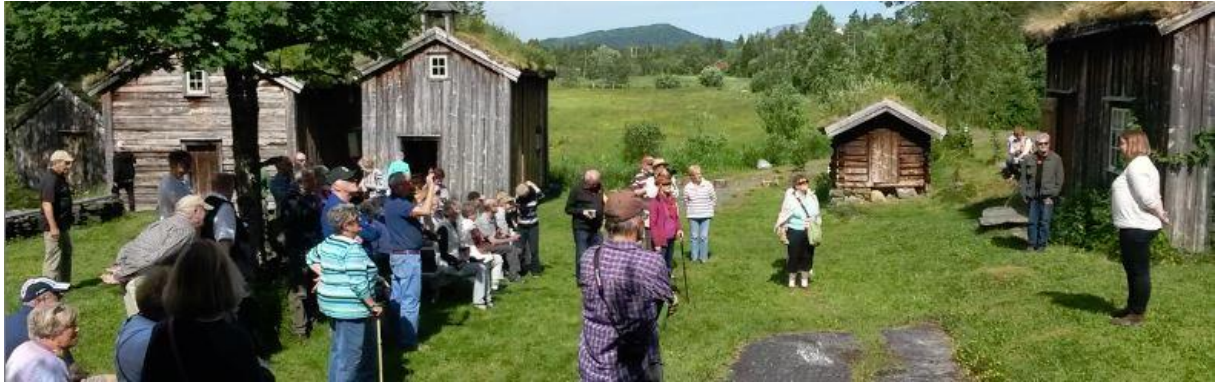
Cruiseturister på Minnetun, juni 2016.