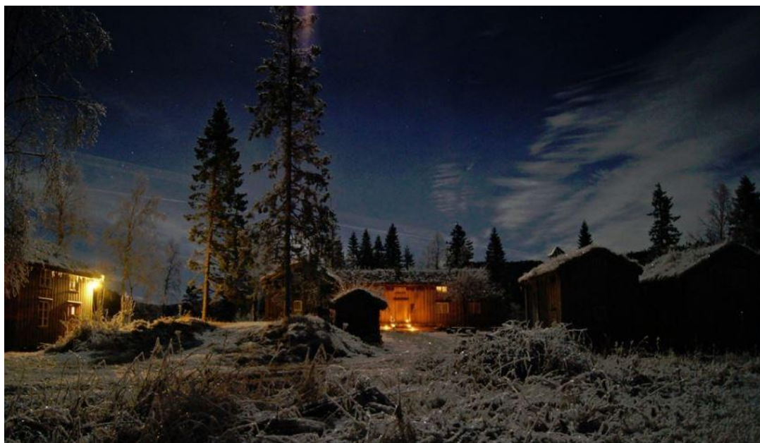
"Løssi Langnatt" i Langfjordhågstua på Minnetun, desember 2016.

I 2016 har Helgeland Museums avdeling i Velfjord hatt en høy publikumsrettet aktivitet og vært et møtested i lokalsamfunnet. Avdelinga har også hatt økt samarbeidet med lag, foreninger, offentlige og private aktører.